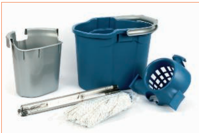
31330300 MOCHO + STRIZZAMOCHO C.MAN.SMONT.8101590 sfuso CartoNet, mast Cartone 4, pall Pal