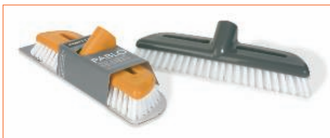
2358100 SPAZZOLONE PABLO 11D sfuso CartoNet, mast Cartone 12