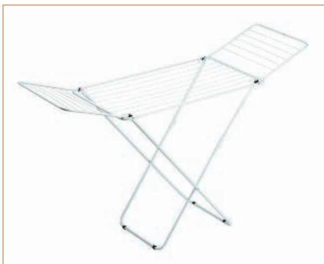
19381600 STENDITORE GIMI PROMO EASY BASIC ALBA sfuso Term.Reotr., mast Cartone 6, pall P