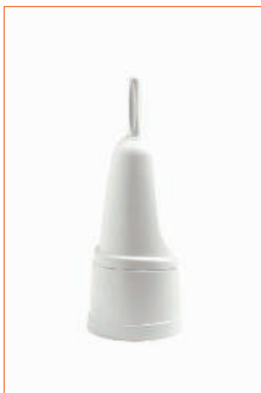
1564200 PORTASCOPINO NUOVO STORNO 10540 sfuso Term.Reotr., mast Cartone 25, pall