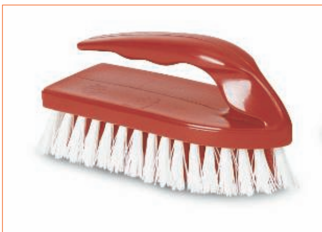
1639900 SPAZZOLA FIBRE BUCATO C.MANICHETTO 114 sfuso Sfuso, mast Cartone 24