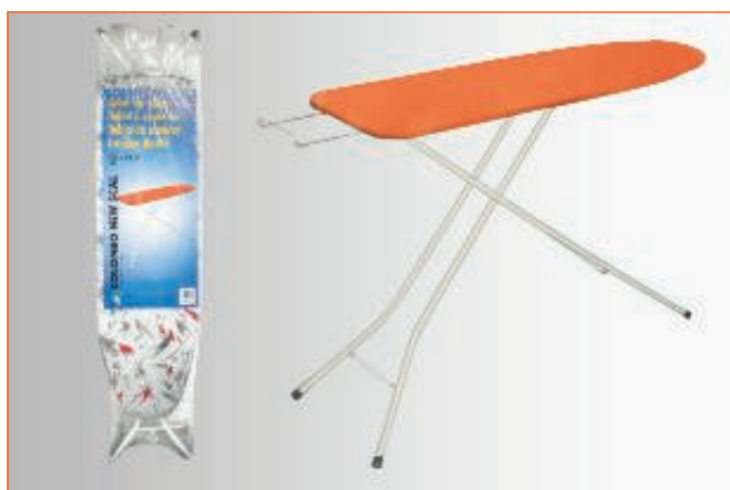
19381500 ASSE STIRO EASY CM.110X32 A122L08W sfuso Term.Reotr., mast Cartone 2, pall P