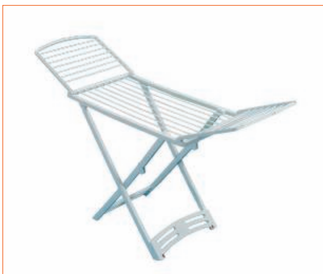
31394400 STENDITORE GIMI ZAFFIRO RESINA C.RUOTE sfuso Term.Reotr., pall Pallett 50