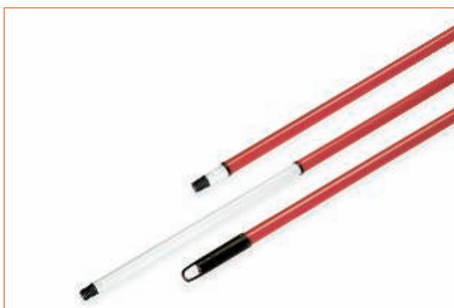
2353900 ASTA METALLO VERNIC. TELESCOPICO 39A sfuso Sfuso, mast Sacchetto 12