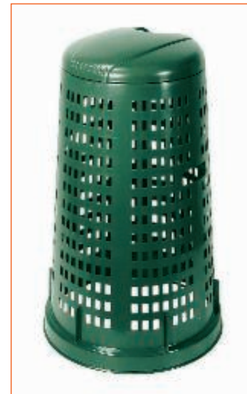
31010800 TRESPOLO P.SACCO STEFAN. 24702 C.COPERC. sfuso Sfuso, pall Pallett 60