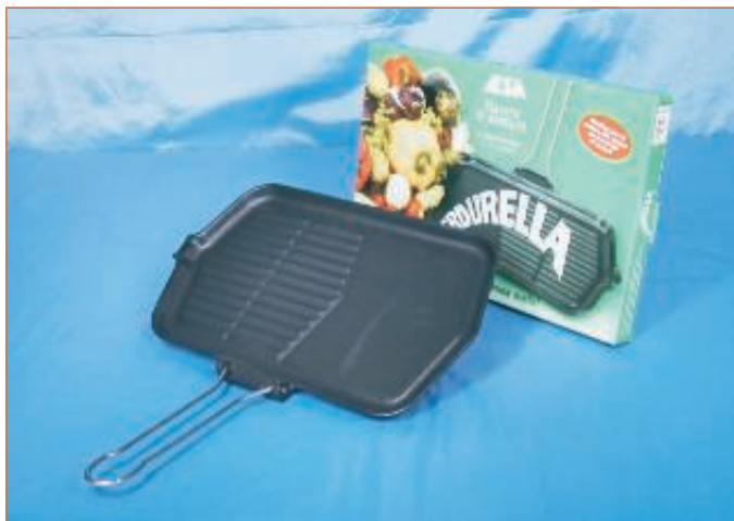
17184100 VERDURELLA-BISTEC. GHISA RETT. 213-23X36 sfuso Scat.litogr., mast Cartone 5