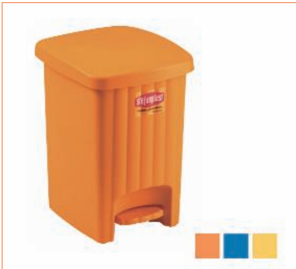
31248400 PATTUM.MARGHERITA QUAD.L.20 C.PED.COL.AS sfuso Sfuso, mast Cartone 6, pall Pallet