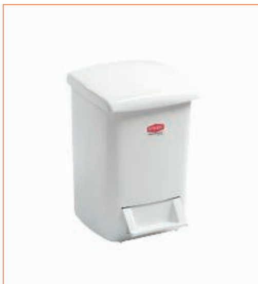
31158400 PATTUMIERA FURBA 2120 C.PED.LT.20 STF sfuso Sacchetto, mast Cartone 6, pall Pa