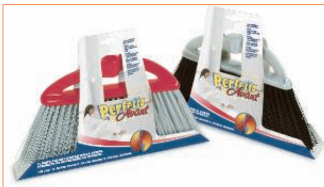
2357800 SCOPA PER INTERNI-ESTERNI AVANT 11G sfuso CartoNet, mast Cartone 6