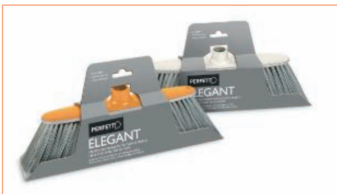
2357900 SCOPA CON PARACOLPI ELEGANT 12H sfuso CartoNet, mast Cartone 6