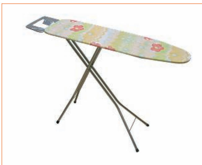
19356400 LA DOLCE VITA-ASSE STIRO 110X32 122L09 sfuso Term.Reotr., mast Cartone 2, pall P