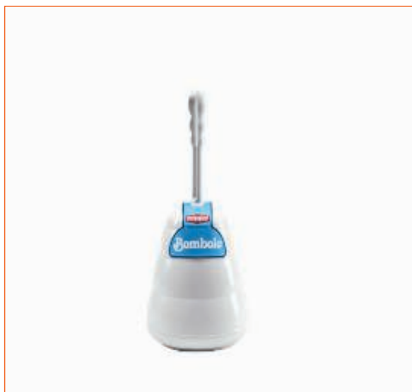
31208900 PORTASCOPINO BOMBOLO 10570 BI.STF sfuso Sacchetto, mast Cartone 12, pall P