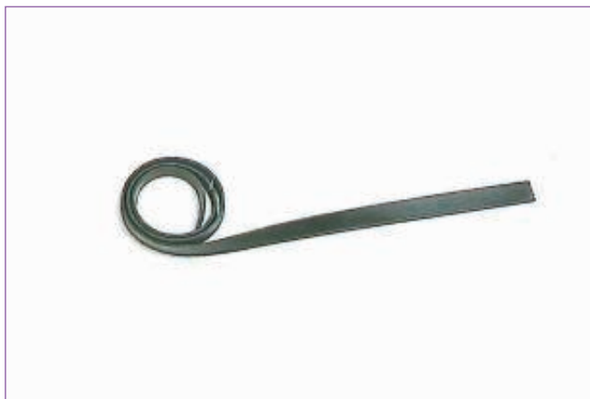
3113000 LAMINA GOMMA SUPP.TERGIVETRO CM.92 8150C sfuso Busta, mast Cartone 100