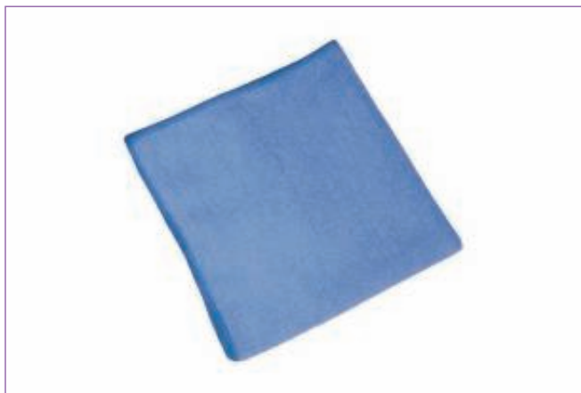
590200 PANNO MICROF. BLU CM40X40 CF.5 TCH101020 sfuso Sacchetto, mast Cartone 40