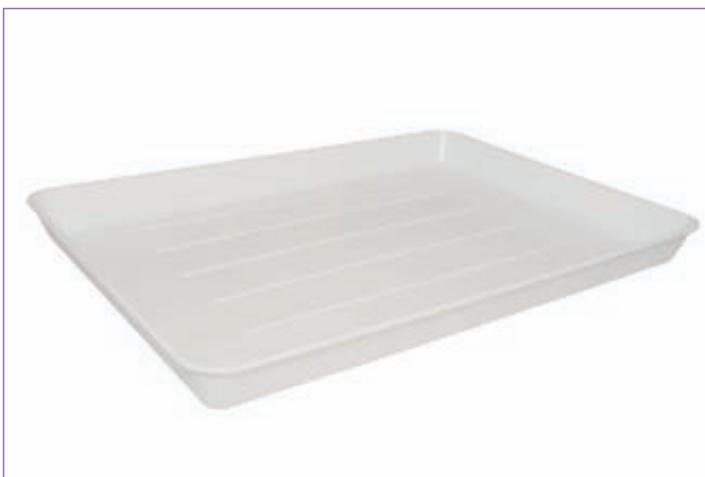
31140200 PIATTO FRIGOR 55X34 GIGAN 4450RC sfuso Sfuso, conf Sacchetto 6