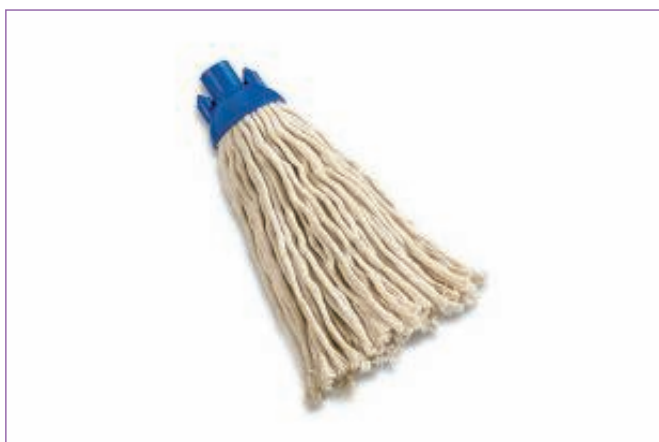
986300 MOP COTONE GROSSO C.ATTACCO A VITE 1859 sfuso Sacchetto, mast Cartone 50