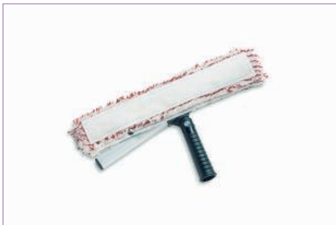
782800 VELLO STRIATO C.ABR.SNOD.CM.45 8212C sfuso Sfuso, mast Cartone 12