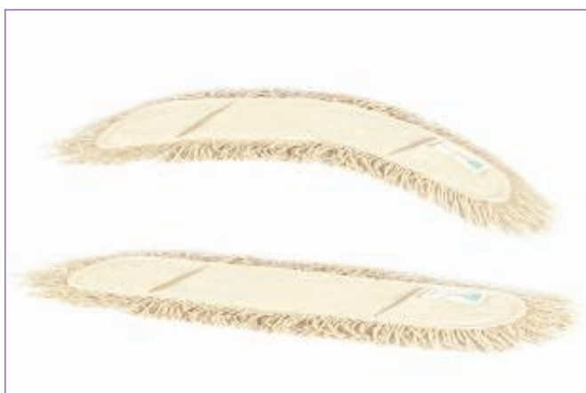
3111300 SET 2 FRANGE COT. X TELAIO FORB.100 400C sfuso Sfuso, mast Cartone 15