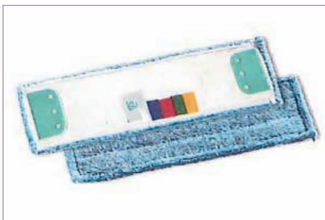
1063100 PANNO WEST MICRIFIBRA BLU CM.40X13 695C sfuso Sfuso, mast Cartone 25