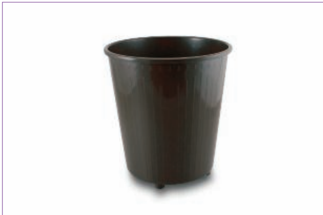
588200 CESTINO GETTACARTA PIENO CM 30 1950-M sfuso Sfuso, mast Sacchetto 6 588100 CESTINO GETTACARTA PIENO CM27 GRIG.1950M sfuso Sfuso, mast Sacchetto 6