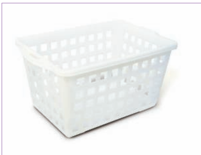
572800 CESTA FORATA CM 70X45X40 BIANCO 2200HD sfuso Sfuso, mast Sacchetto 3 858900 CESTA FORATA CM.50X34X30 BIANCO 2200HD sfuso Sfuso, mast Sacchetto 6