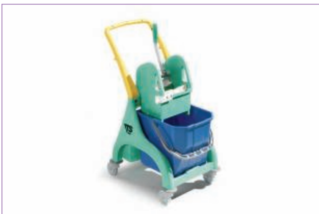
985900 CARRELLO NICK VERDE LT.25 C.MANIGL.6249 sfuso Cartone