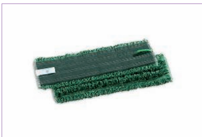
986100 RICAMBIO MICRO-RIC.CM.42 VELCRO OVV745MV sfuso Sfuso, mast Cartone 25