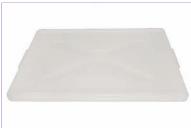
31252700 COPERCHIO X CASSETTA SERVICE 60X40 9195M sfuso Sfuso, mast Sacchetto 6