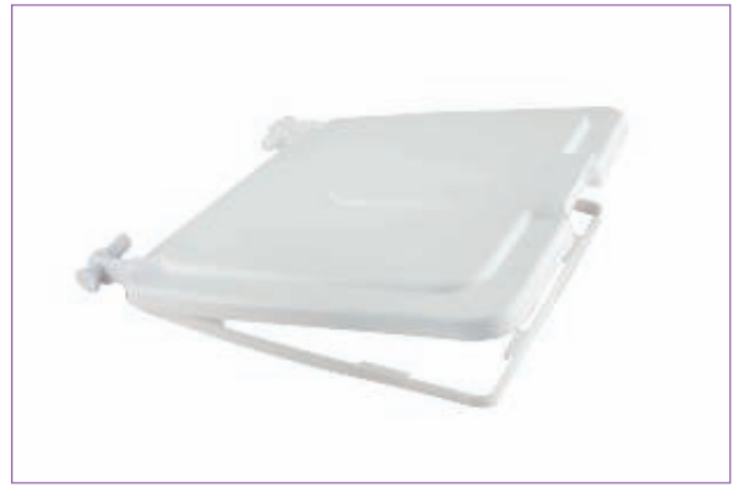
31448400 COPERCHIO X CONTENITORE MAX LT.100 9015M mast Cartone (qta min vend.12)