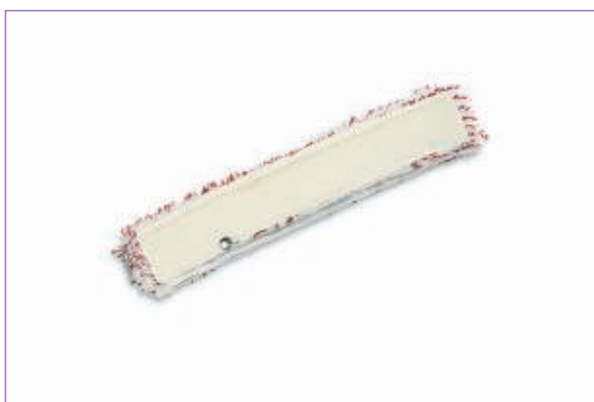
783100 VELLO RICAMBIO STRIATO C.ABR.CM.45 8422C sfuso Sfuso, mast Cartone 25