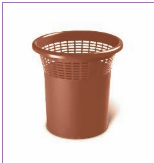
109900 CEST.GETTACARTA MARR.STUD.32,5X33H 2000M sfuso Sfuso, mast Sacchetto 3