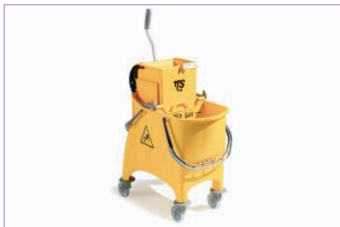
589100 CARRELLO WITTY LT.30 PULIZIE 6450 sfuso Cartone