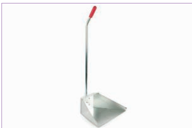
3112300 ALZAIMMOND.METAL.C.MANICO 33X36X76 5641 sfuso Sc.interna, mast Cartone 12