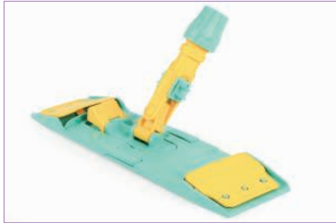
1063200 TELAIO WET SYS. CM.40X11 CON BOCCH.868YC sfuso Sfuso, mast Cartone 10