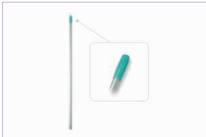
1829600 MANICO ALL.C.FORO CM.150 DIAM.CM23 1042C sfuso Sfuso, mast Cartone 25