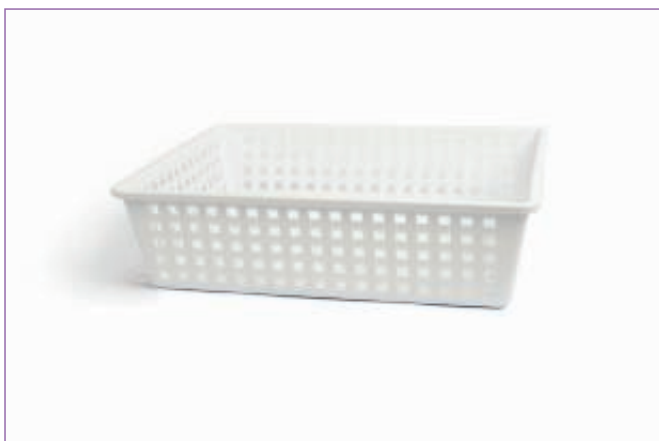
730900 CESTA FORATA CM 40X30X10 BIANCO 2250M sfuso Sfuso, mast Sacchetto 6 31197000 CESTA FORATA 50X34X11 GIGAN S-COP 2250 sfuso Sfuso, mast Sacchetto 6