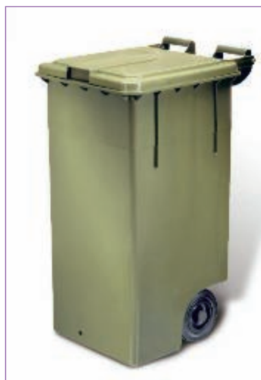
345900 CONTENITORE MAX LT 100 VERD.C.COP.2800HD sfuso Sfuso, mast Term.Reotr.