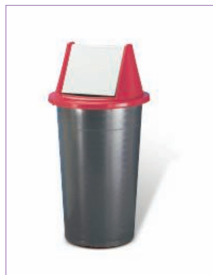
31105200 BIDONE IMMOND. ONDINA 5050P-44 L.60 C.CO sfuso Sfuso, mast Sacchetto 3