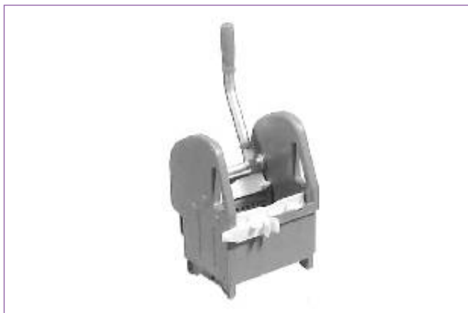
2400000 STRIZZATORE TEC A GANASCE 0003740 sfuso Sc.interna, mast Cartone 4