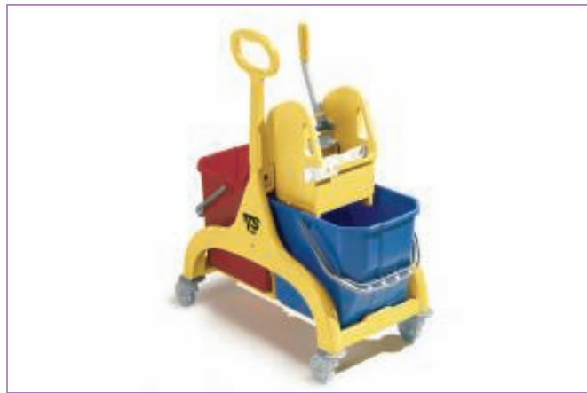
588800 CARRELLO NICK GIALLO C.MAN.A OMBREL.6185 sfuso Cartone