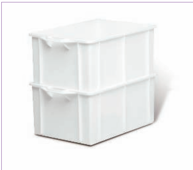
31262300 CONTENIT SOVRAPP GIGAN 40X30X21- 2600M sfuso Sfuso, mast Sacchetto 2 31210000 CONTENIT SOVRAPP GIGAN 62X40X30- 2600M sfuso Sacchetto 31134500 CONTENIT SOVRAPP.GIGAN BIA50X40X25-2600M sfuso Sfuso, mast Sacchetto 2