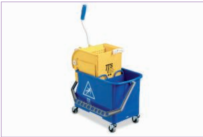
1968800 CARRELLO SECCHIO DOPPIO LT.20 36394 sfuso Scat.litogr., mast Cartone 1