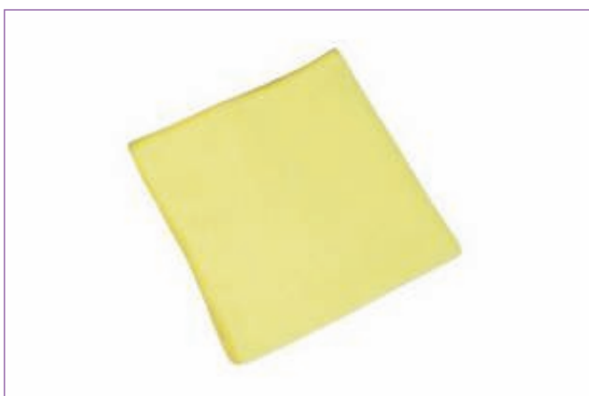
590300 PANNO MICROF.VERDE CM40X40 CF5 TCH101040 sfuso Sacchetto, mast Cartone 40