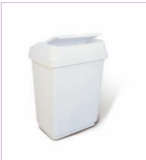
346500 CONTENITORE TOP BIANCO LT 25 C.COP.2310M sfuso A Vista