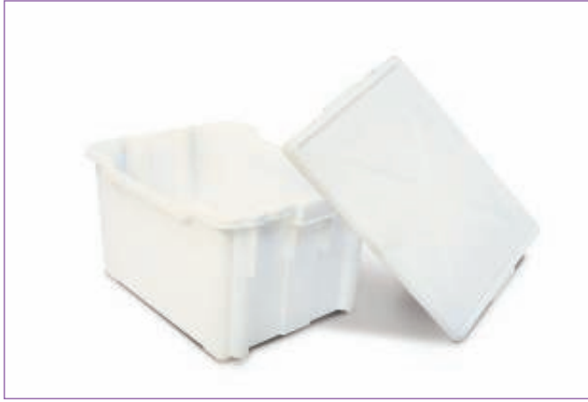
31102800 COPERCHIO X CONT.GIGAN. 75X50 9175M sfuso Sfuso, conf Sacchetto 6, mast Cart