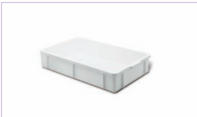
31155400 CASSETTA TRANSPORT 60X40X20-GIGANP 1875 sfuso Sfuso, mast Sacchetto 2