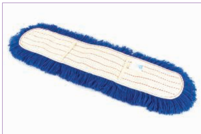
3112000 FRANGIA ACRILICO X SCOPE LINE.40X13 141C sfuso Sfuso, mast Cartone 40 3112100 FRANGIA ACRILICO X SCOPE LINE.60X13 142C sfuso Sfuso, mast Cartone 30 3112200 FRANGIA ACRILICO X SCOPE LINE.80X13 143C sfuso Sfuso, mast Cartone 30