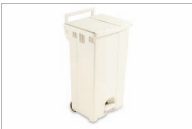
589900 CONT.DERBY LT.90 CON COPER.BEIGE 5670 sfuso Sfuso, mast Cartone 2