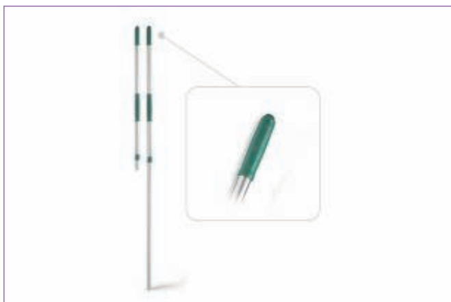
589600 MANICO ALL.TELESCOPIO 1044C sfuso Sfuso, mast Cartone 10