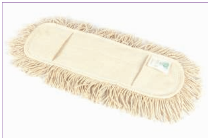
3111700 FRANGIA COTONE X SCOPE LINEAR 40X13 135C sfuso Sfuso, mast Cartone 60 3111800 FRANGIA COTONE X SCOPE LINEAR 60X13 136C sfuso Sacchetto, mast Cartone 40 3111900 FRANGIA COTONE X SCOPE LINEAR.80X13 137C sfuso Sfuso, mast Cartone 40