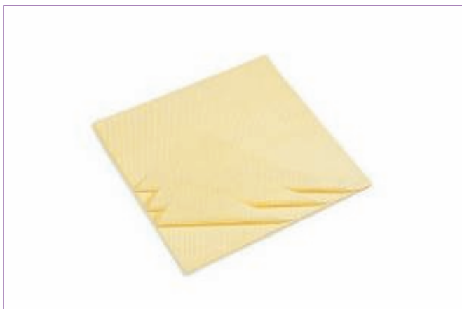
590100 PANNO ANTIST.CM.28X62 GIALLO CF.100 754C sfuso Sacchetto, mast Cartone 8