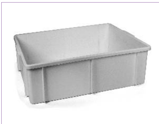
31149200 CASSETTA TRANSPORT 60X40X06 GIGANP 1875M sfuso Sfuso, mast Sacchetto 6, pall Pall 31114700 CASSETTA TRANSPORT 60X40X11-GIGANP 1875M sfuso Sfuso, mast Sacchetto 3, pall Pall