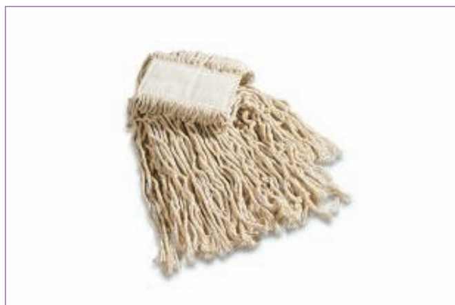
589400 MOP MEDIO COTONE GR.400 1201C sfuso Sacchetto, mast Cartone 50