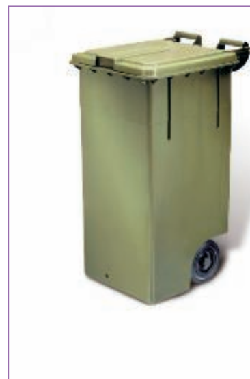
31438300 CONTENIT. MAX L.120 C-COP BIANCO 2800HD sfuso Sfuso