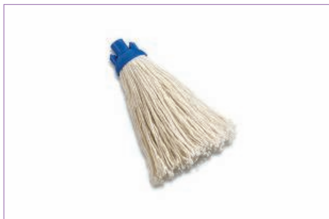
986200 MOP COTONE FINE C.ATTACCO A VITE 1868 sfuso Sacchetto, mast Cartone 50