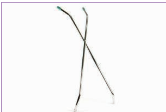
3111100 MANICO A FORBICE CROMATO 00001050C sfuso Sfuso, mast Cartone 10