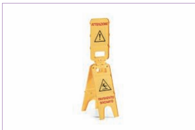
589300 SEGNALE TRIS PAVIMENTO BAGNATO 3571C sfuso , mast Cartone 5