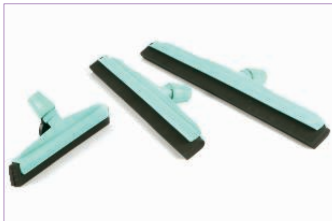
3112500 SPINGIACQUA PP DOPPIA LAMA CM.35 8630C sfuso Sfuso, mast Cartone 10 3112600 SPINGIACQUA PP DOPPIA LAMA CM.45 8631C sfuso Sfuso, mast Cartone 10 3112700 SPINGIACQUA PP DOPPIA LAMA CM.55 8632C sfuso Sfuso, mast Cartone 10