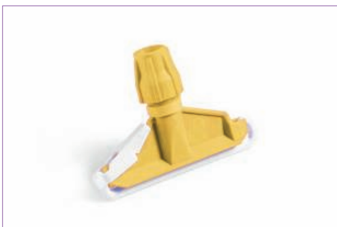
589500 PINZA MOP GIALLA IN PLASTICA 1907C sfuso Sfuso, mast Cartone 50