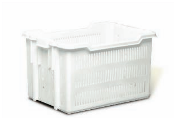
31115000 CONTENIT TRANSP.TRAF. 75X50X45 GIG 8350 sfuso Sfuso, mast Sacchetto 2