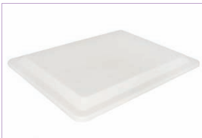
31135100 COPERCHIO PER BACINEL. FRIGOR 1660 40X30 sfuso Sfuso, conf Sacchetto 6, mast Cart 110200 COPERCHIO PER BACINEL.FRIGO 34X24 1660M sfuso Sfuso, mast Sacchetto 6