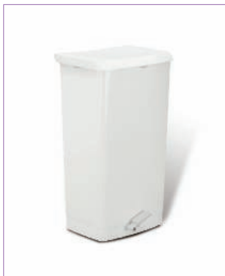
31125900 BIDONE IMMOND.UNIVERSAL 5075-M L.60 C.PE sfuso Sfuso, mast Cartone 3