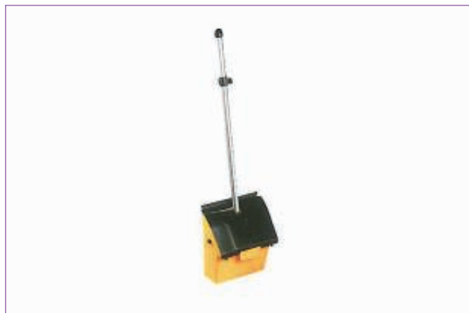
3112400 PALETTA CLIP NERA C.COP.CM28X29X85 5624 sfuso , mast 4