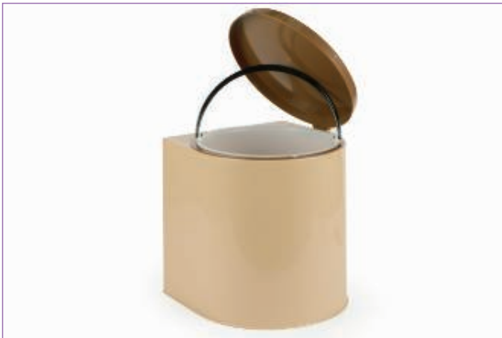
31116300 PATTUMIERA PLAST. PENSILE GIGA 4180-M sfuso Term.Reotr., mast Cartone 8, pall P