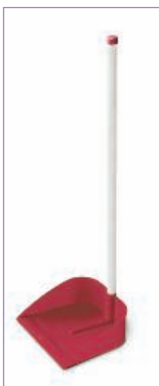
31439100 ALZAIMMONDIZIE CON BASTONE 25X22X82 50M sfuso Sfuso, conf Sacchetto 18, mast Car