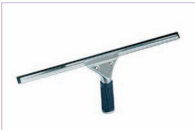
782700 TERGIVETRO FISSO INOX CM.55 8056A sfuso Sacchetto, mast Cartone 10