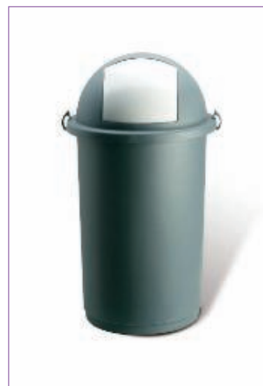
112100 BIDONE PUSH C.COP. LT.50 BLU 5055M sfuso Sacchetto, mast Cartone 3