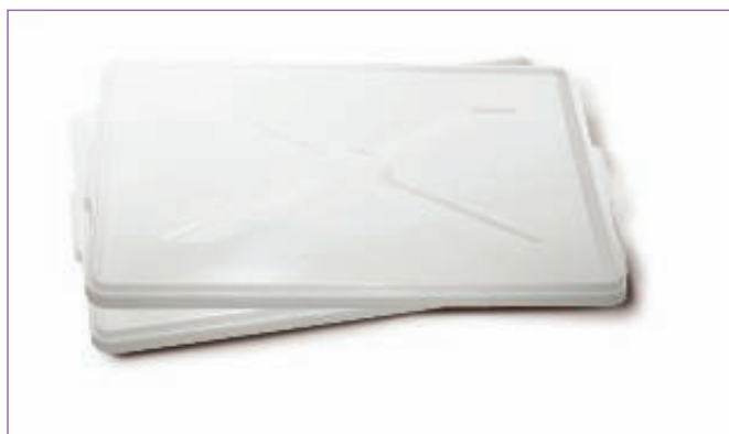
31257600 COPERCHIO X CASSETTA TRANSPO.60X40 9190M sfuso Sfuso, conf Sacchetto 6, mast Cart