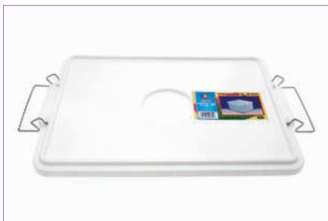
1658100 COPERCHIO C.M.CASSETTA SOVRAP45X35 9090M sfuso Sfuso, mast Sacchetto 6 1696700 COPERCHIO C.M.CASSETTA SOVRAP62X40 9090M sfuso Sfuso, mast Sacchetto 6