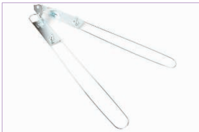
3111200 TELAIO A FORBICE ZINCATO 100X90 0000915C sfuso Sfuso, mast Cartone 10