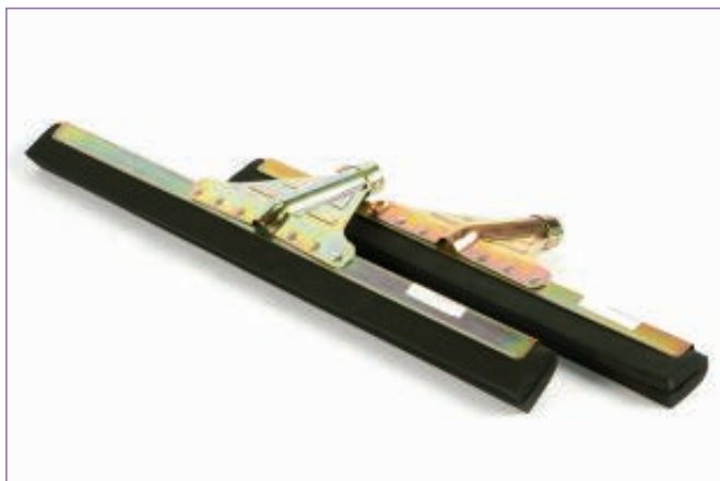
3112800 SPINGIACQUA METALLO LAMA NERA CM45 8611C sfuso Sfuso, mast Cartone 12 3112900 SPINGIACQUA METALLO LAMA NERA CM55 8612C sfuso Sfuso, mast Cartone 12